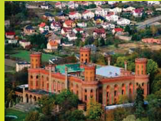
Pałac Kamieniec Ząbkowicki

Gmina Kamieniec Ząbkowicki ukształtowanie terenu i krajobraz zawdzięcza Nysie Kłodzkiej, która ciągnie się przez teren gminy na długości ponad 10 km. Rzeka uchodzi do zbiorników zaporowych Topola i Kozielno, które powstały na początku XXI w. W gminie znajdują się również stawy pożwirowe Pilce i Bartniki, które bardzo ciekawie wtapiają w panoramę wschodniej części Sudetów. Bliskość gór, stawów, zbiorników zaporowych i dolina Nysy sprawiają, że jest to miejsce niezwykle tajemnicze, niespotykane praktycznie nigdzie indziej w Polsce.