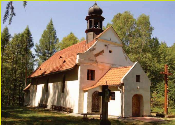
Kaplica mszalna p.w. św. Anny

Oto skarby gościnnej gminy Ciepłowody – otwartej dla turystów przez cały rok. Jeśli chcesz odpocząć od miasta i zaczerpnąć pozytywnej energii na cały tydzień – nie musisz szukać daleko. Przepiękne pocztówkowe widoki, bujna i nieskalana przyroda, spokój i czyste powietrze – to wszystko znajdziesz u nas! Łagodne wzniesienia i gęsta sieć dróg leśnych i polnych stwarzają dogodne warunki do uprawiania turystyki pieszej i rowerowej a w śnieżne zimy wędrówek na nartach śladowych. Do Ciepłowod zawsze blisko! Zapraszamy!