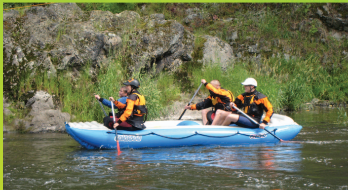
Przystań pontonowa

Jest też Bardo rajem dla wodniaków. Jedną z największych atrakcji regionu stanowi antecendentny Przełom Bardzki. Nysa Kłodzka płynie tu malowniczą, krętą doliną, tworząc pięć wielkich meandrów, wcinających się w skały. Spływ szlakiem Przełomu Bardzkiego staje się wędrówką wśród sielankowych łąk i wzgórz, w otoczeniu pięknej przyrody i śpiewu ptaków.