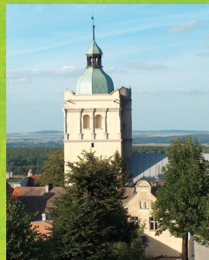
Kościół ewangelicki

Wszystkie te zabytki oraz szereg innych obiektów tworzy Miejską Trasę Turystyczną. Gmina stawiając na aktywne formy sportu, turystyki i wypoczynku jest współorganizatorem wielu imprez i zawodów o randze ogólnopolskiej i międzynarodowej w Dog Trekingu, kolarstwie górskim, Nordic Walkingu i innych. Wszyscy turyści odwiedzający Gminę Złoty Stok mogą ponadto skorzystać z Ośrodka Rekreacji Konnej, Sport Kompleksu posiadającego w swojej bazie - hotel, siłownię, halę gimnastyczną i stołówkę, oraz Ośrodka Naturoterapii - zakładu medycyny niekonwencjonalnej oferującego między innymi ozonoterapię, hiduroterapię, akupunkturę oraz wiele innych zabiegów odnowy biologicznej. Ciszę i ukojenie można również znaleźć w pensjonacie EL-TAN z 24 miejscami noclegowymi oraz w gospodarstwach agroturystycznych takich jak: „U Alberta” oferujący wędkowanie i przejażdżki rowerowe a także „Trzy Koguty” oferujące niepowtarzalny smak konfitur domowych. Złoty Stok to jedna z nielicznych gmin, w której odpoczywa się zdrowo, aktywnie i bogato. Złoto jest dla wszystkich, nie tylko dla zuchwałych.