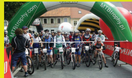
MTB Marathon