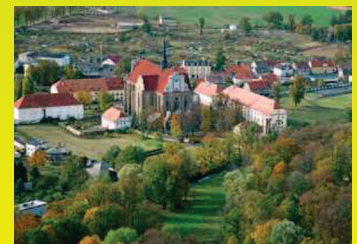
Obiekty klasztoru pocysterskiego, fot. Romuald M. Soldek