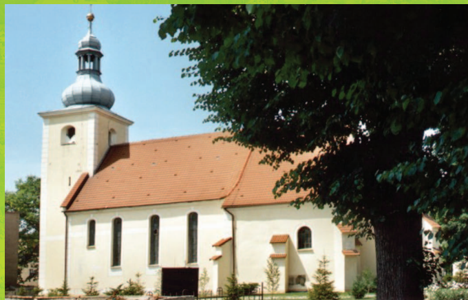
Kościół parafialny Niepokalanego Poczęcia N.M.P.

w Henrykowie od 1282 r. aż do jego sekularyzacji w 1810 r. Cystersi mieli tutaj duży folwark, natomiast nigdy nie było tu kościoła a ludność należała do parafii w pobliskim Starym Henrykowie. Na Kaplicznym Wzgórzu we wspomnianym Lesie Bukowym znajduje się barokowa kaplica św. Anny z 1707 r. a wokół niej XIX wieczna Kalwaria. Miejsce to było w XIX i w pierwszej połowie XX w.