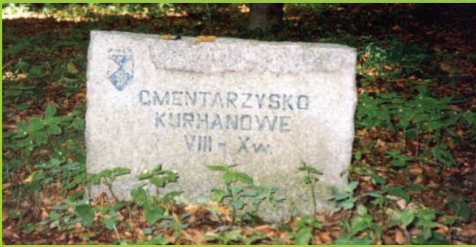
Cmentarzyska kurhanowe w Lesie Bukowym

Z Muszkowic blisko już do Starego Henrykowa, słynnego z pięknego, barokowego kościoła p.w. Św. Marcina, wzniesionego przez cystersów w XVIII w.