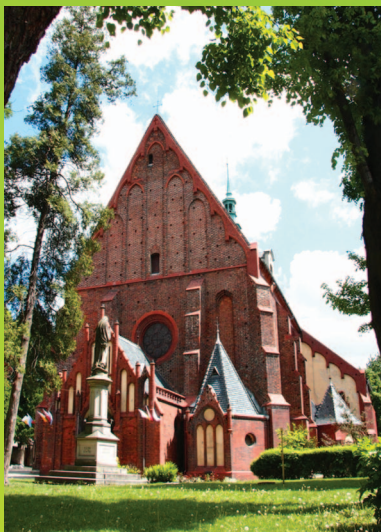
Kościół p.w. św. Anny

prawdopodobnie wkrótce po lokacji miasta. Pierwszy dokument wskazujący na to, że znajdował się w Zabkowicach, pochodzi z 27 września 1292 roku. Jednak bardzo szybko uległ zniszczeniu, gdyż w połowie XIV wieku spalił się. Nową świątynię ufundował król czeski, Karol IV. Jako datę ukończenia budowy podaje się 1413 lub 1415 rok. Również