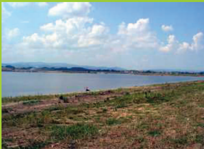
Zbiornik wodny Topola