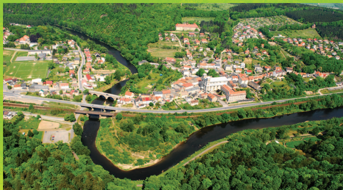
Widok z lotu ptaka

Doskonale skomunikowane: droga krajowa nr 8 Wrocław – Kudowa, stacja PKP, PKS, jest Bardo idealną bazą weekendowych wyjazdów, dla osób szukających wytchnienia od wielkomiejskiego gwaru.