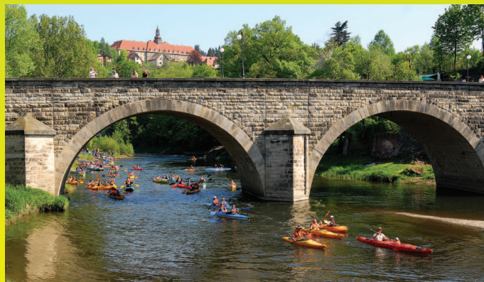
Spływ Przełomem Bardzkim

jednocześnie najstarszej drewnianej rzeźby na Dolnym Śląsku, pielgrzymowali przez wieki pątnicy z Czech i Śląska; w XVIII wieku odprawiano tu rocznie 4000 fundowanych mszy! Ogromna świątynia, w której króluje Matka Boska Bardzka Strażniczka Wiary, powstała w latach 1686-1704. Swoją przepiękną wystój zawdzięcza znanym na Śląsku barokowym artystom. Szczególnie piękny jest prospekt organowy, dzieło rzeźbiarza Heinricha Hartmanna i ołtarz główny, dzieło Mikołaja Richtera, na którym umieszczona jest cudowna figura. Bazylika, przylegający do niej klasztor i inne liczne ślady działalności cysterskiej sprawiają, że Bardo jest jednym z ważniejszych punktów na południowo-zachodnim Szlaku Cystersów w Polsce. Podobnie jak w innych klasztorach Dolnego Śląska Cystersi prowadzili tu działalność aż do czasu sekularyzacji.