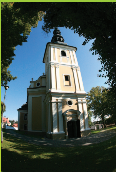
Kościół p.w. św. Jadwigi

Ołtarz św. Wita uległ zwęgleniu, a malowidła zostały mocno uszkodzone przez dym. W roku 1919 malarze Schneider i Kurz przeprowadzili prace restauratorskie i udało się uratować większość dzieł. Odnowiono wówczas także całe wnętrze. Całkowity koszt prac wyniósł 30000 marek. Kościół jest przykładem architektury barokowej z barokowym i rokokowym wyposażeniem wnętrza.