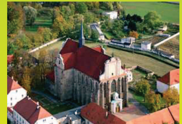
Kościół parafialny p.w. WNMP