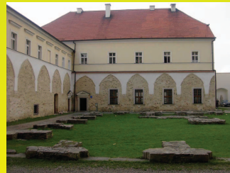
Kamieniecka Izba Pamiętek