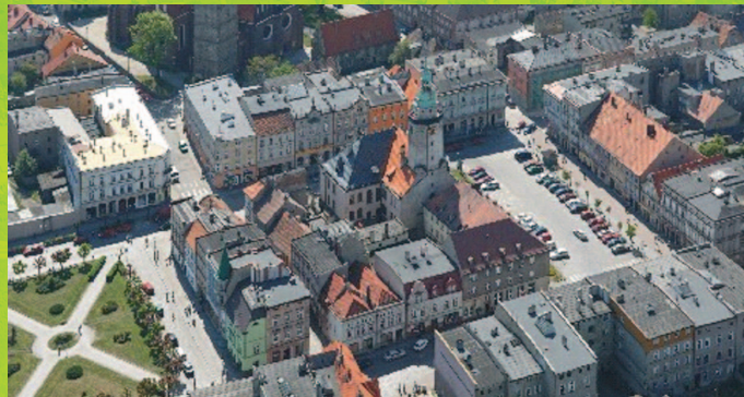
Widok Ziębic z lotu ptaka

Ratusz stanowi ilustrację dziejów miasta, wyrażoną na obrazach naciennych i na witrażach. Obecnie w ratuszu mieści się Urząd Stanu Cywilnego oraz muzeum regionalne - Muzeum Sprzętu Gospodarstwa Domowego. Jest to jedyne w Polsce muzeum specjalizujące się w ekspozycji sprzętów gospodarstwa domowego.