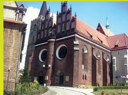
Kościół św. Jerzego

Kościół św. Jerzego - Sanktuarium Męki Pańskiej Bazylika Mniejsza jest najstarszym zabytkiem miasta, powstałym z połączenia hali dwunawowej wczesnogotyckiej z lat 1265-75 i trójnawowego prezbiterium późnogotyckiego z lat 1477-1504. Późniejsze przebudowy kościoła nie zatarły pierwotnego wyposażenia i w efekcie w kościele łączą się elementy gotyckie, renesansowe, barokowe i rokoko. Obok kościoła kamienna dzwonnica z XV wieku.