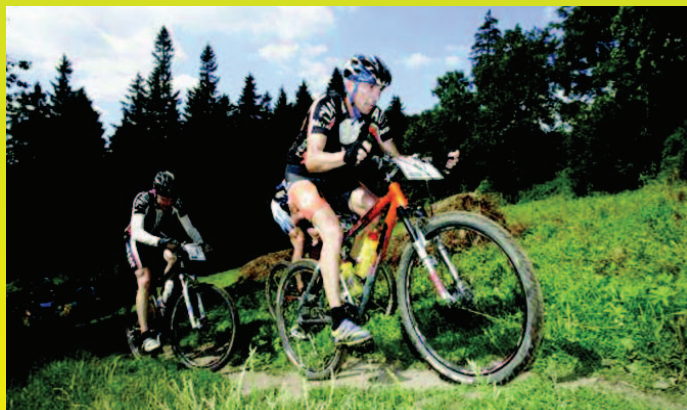
Wyścig Bike Challenge

Niemniej atrakcyjne dla turystów są najbliższe okolice miasta. Góry Bardzkie mają niezwykle urozmaicone formy, a ich malownicze pejzaże przyciągają wielbicieli łowienia aparatem fotograficznym urody świata. Przyroda sprawia, że gmina Bardo jest rajem dla rowerzystów, wędrówców, kajakarzy, wędkarzy, grzybiarzy i myśliwych, a miasteczko staje się ośrodkiem turystyki aktywnej.