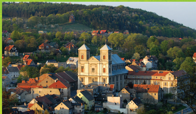
Widok , fot. K. Gnach

jednocześnie najstarszej drewnianej rzeźby na Dolnym Śląsku, pielgrzymowali przez wieki pątnicy z Czech i Śląska; w XVIII wieku odprawiano tu rocznie 4000 fundowanych mszy! Ogromna świątynia, w której króluje Matka Boska Bardzka Strażniczka Wiary, powstała w latach 1686-1704. Swoją przepiękną wystój zawdzięcza znanym na Śląsku barokowym artystom. Szczególnie piękny jest prospekt organowy, dzieło rzeźbiarza Heinricha Hartmanna i ołtarz główny, dzieło Mikołaja Richtera, na którym umieszczona jest cudowna figura. Bazylika, przylegający do niej klasztor i inne liczne ślady działalności cysterskiej sprawiają, że Bardo jest jednym z ważniejszych punktów na południowo-zachodnim Szlaku Cystersów w Polsce. Podobnie jak w innych klasztorach Dolnego Śląska Cystersi prowadzili tu działalność aż do czasu sekularyzacji.