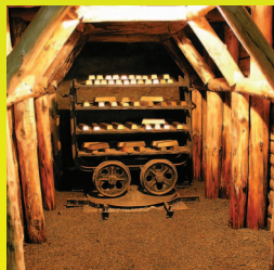
Kopalnia Złota